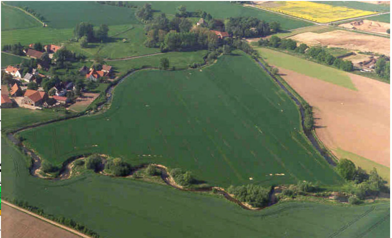
46271 Bega unterhalb Ötternbach und oberhalb Rhienbach